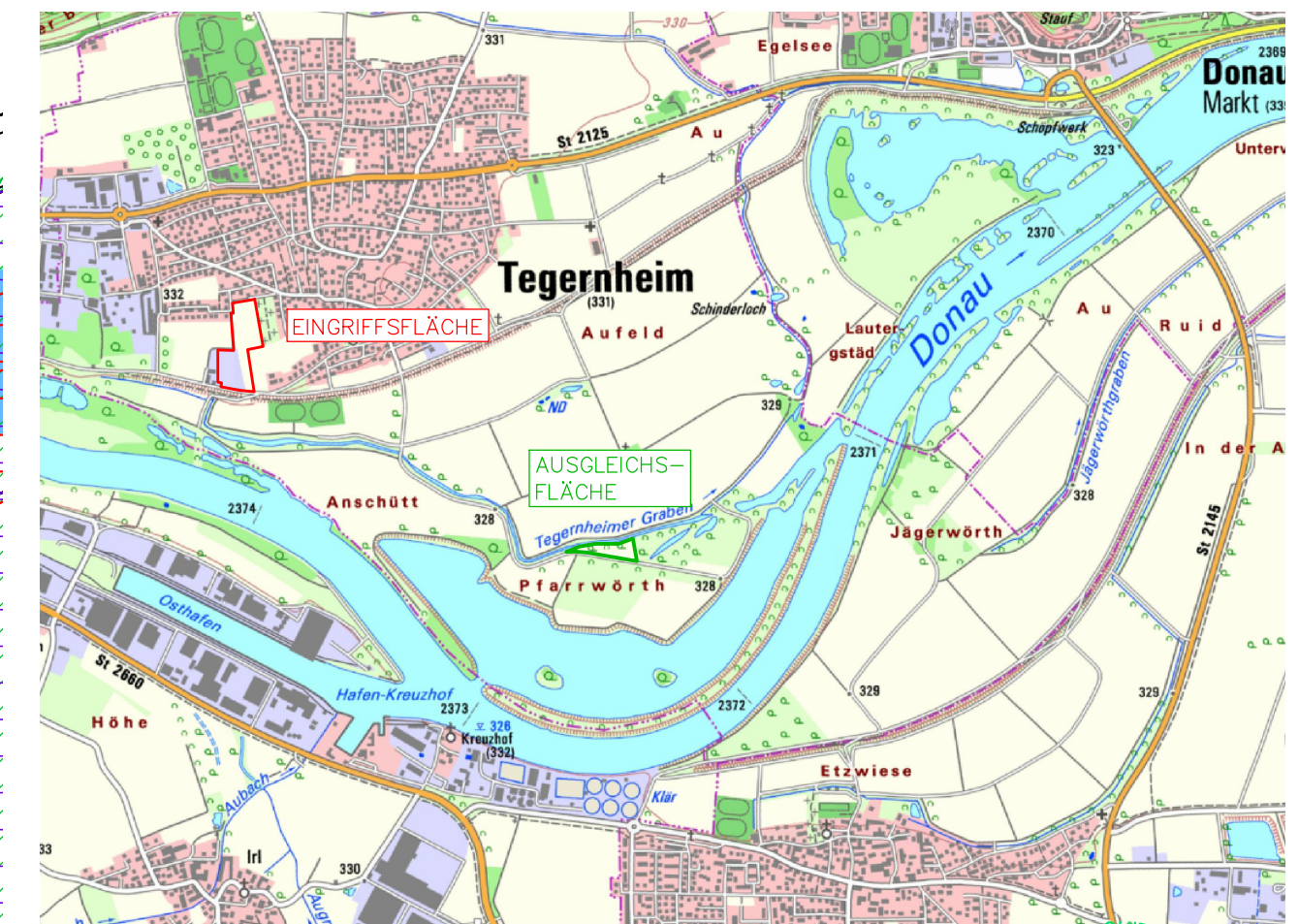
ÜBERSICHTSLAGEPLAN M 1:25.000 AUS DEM BAYERN ATLAS