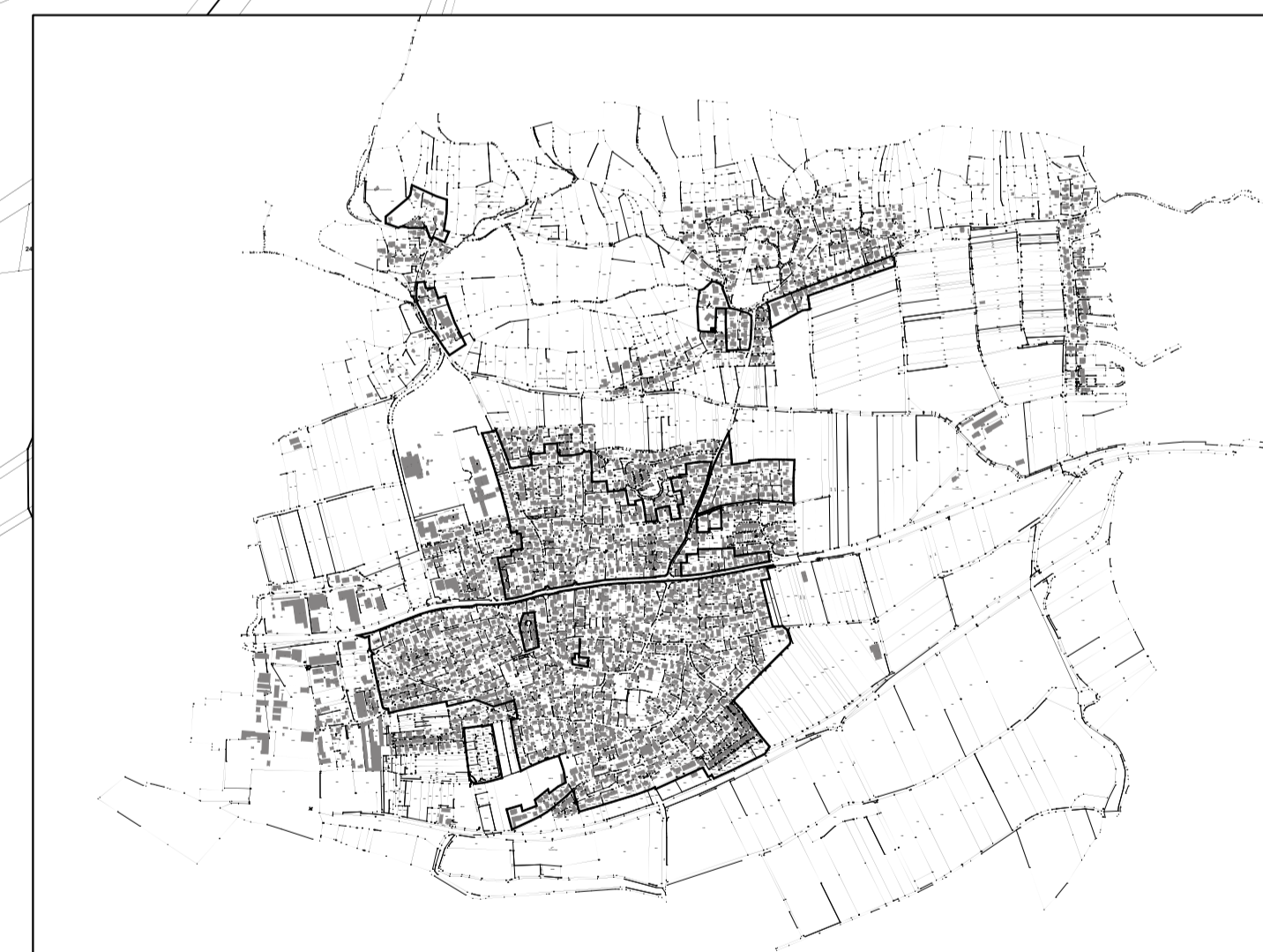
Übersichtslageplan M 1:20.000