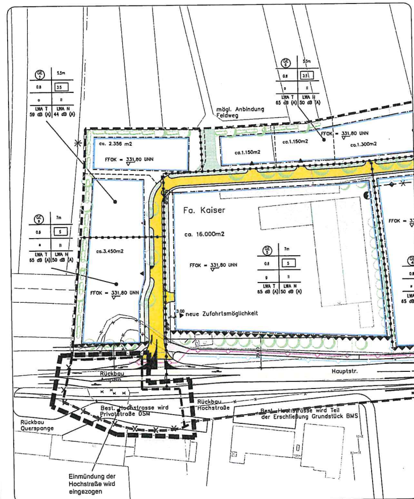
AUSSCHNITT BESTEHENDER BEBAUUNGSPLAN